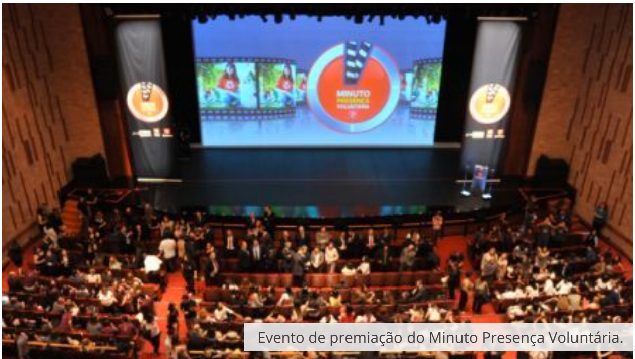
Evento de premiação do Minuto Presença Voluntária.