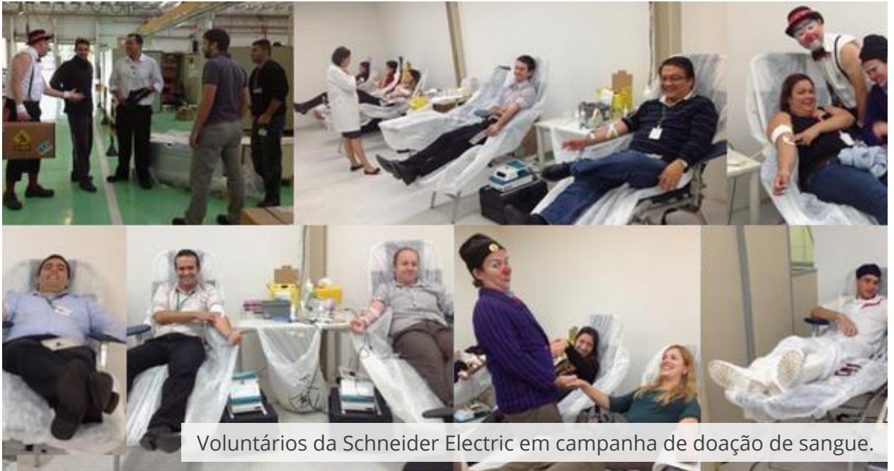
Voluntários da Schneider Electric em campanha de doação de sangue.