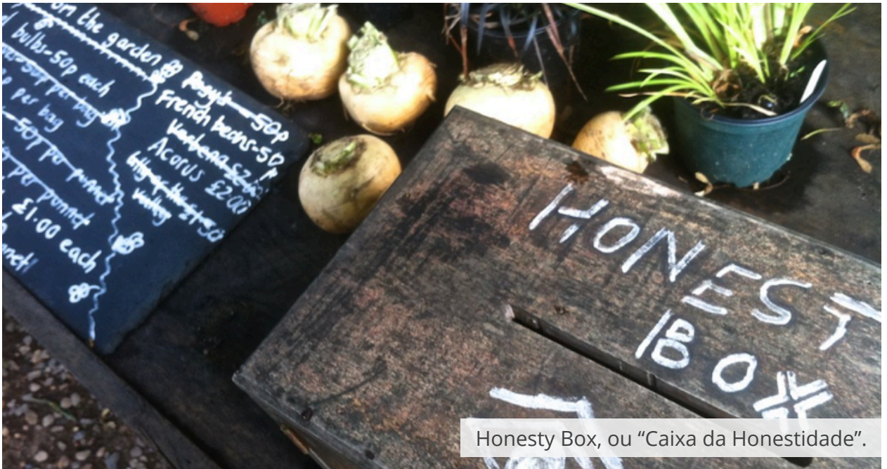
Honesty Box, ou “Caixa da Honestidade”.

A Caixa da Honestidade ( Honesty Box , no original) é costume em alguns países em que as pessoas colocam em seu quintal produtos para vender e deixam uma caixinha para que interessados peguem o produto desejado e coloquem o dinheiro na caixa. Como não há ninguém tomando conta, o “comprador” pode ou não colocar o dinheiro – daí o nome de caixa da honestidade.