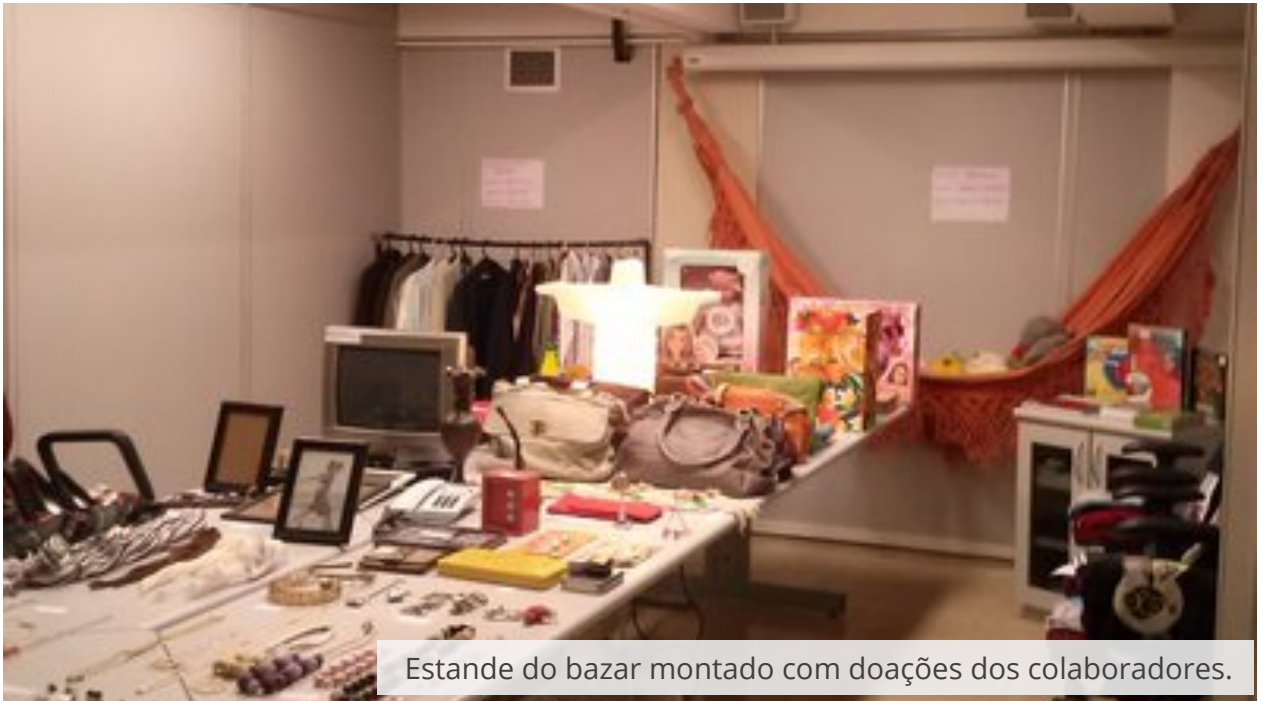
Estande do bazar montado com doações dos colaboradores.