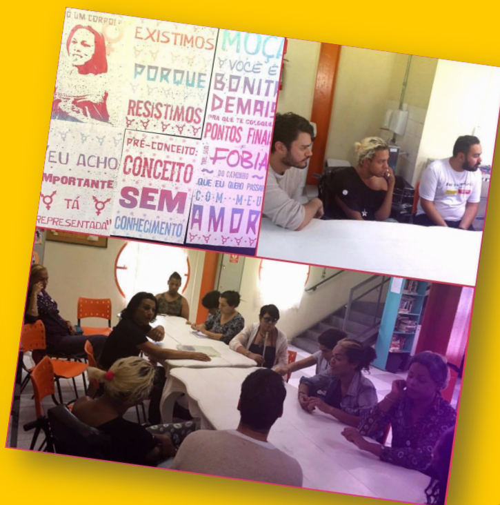
Centro de Acolhida para Mulheres Transexuais e Travestis Florescer