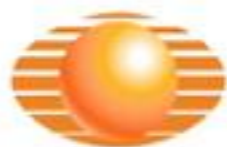
Emilio Azcárraga Jean