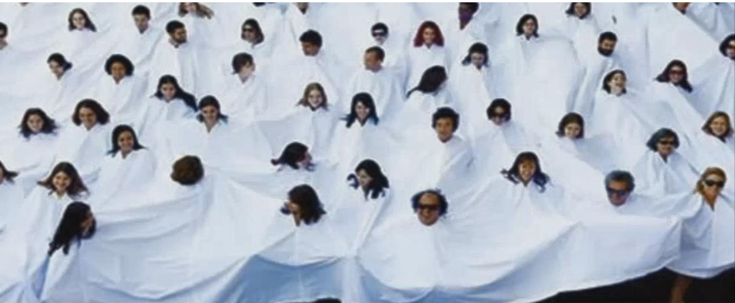
Lygia Pape, artista brasileira Divisor , 1968

“Você não está na rede, você é a rede” Pierre Lévy, filósofo e sociólogo